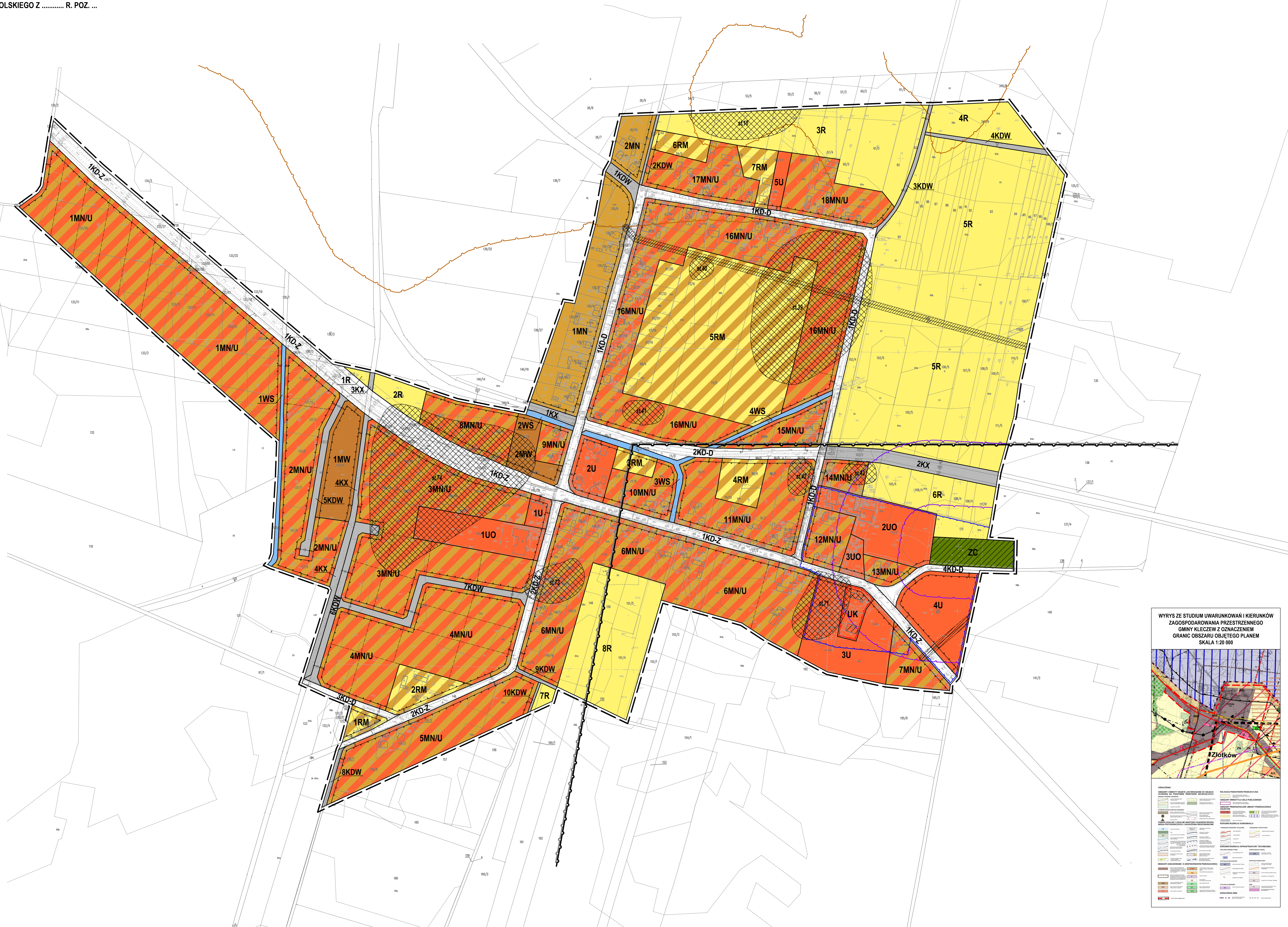
WYRYS ZE STUDIUM UWARUNKOWAŃ I KIERUNKÓW ZAGOSPODAROWANIA PRZESTRZENNEGO GMINY KLECZEW Z OZNACZENIEM GRANIC OBSZARU OBJĘTEGO PLANEM SKALA 1:20 000