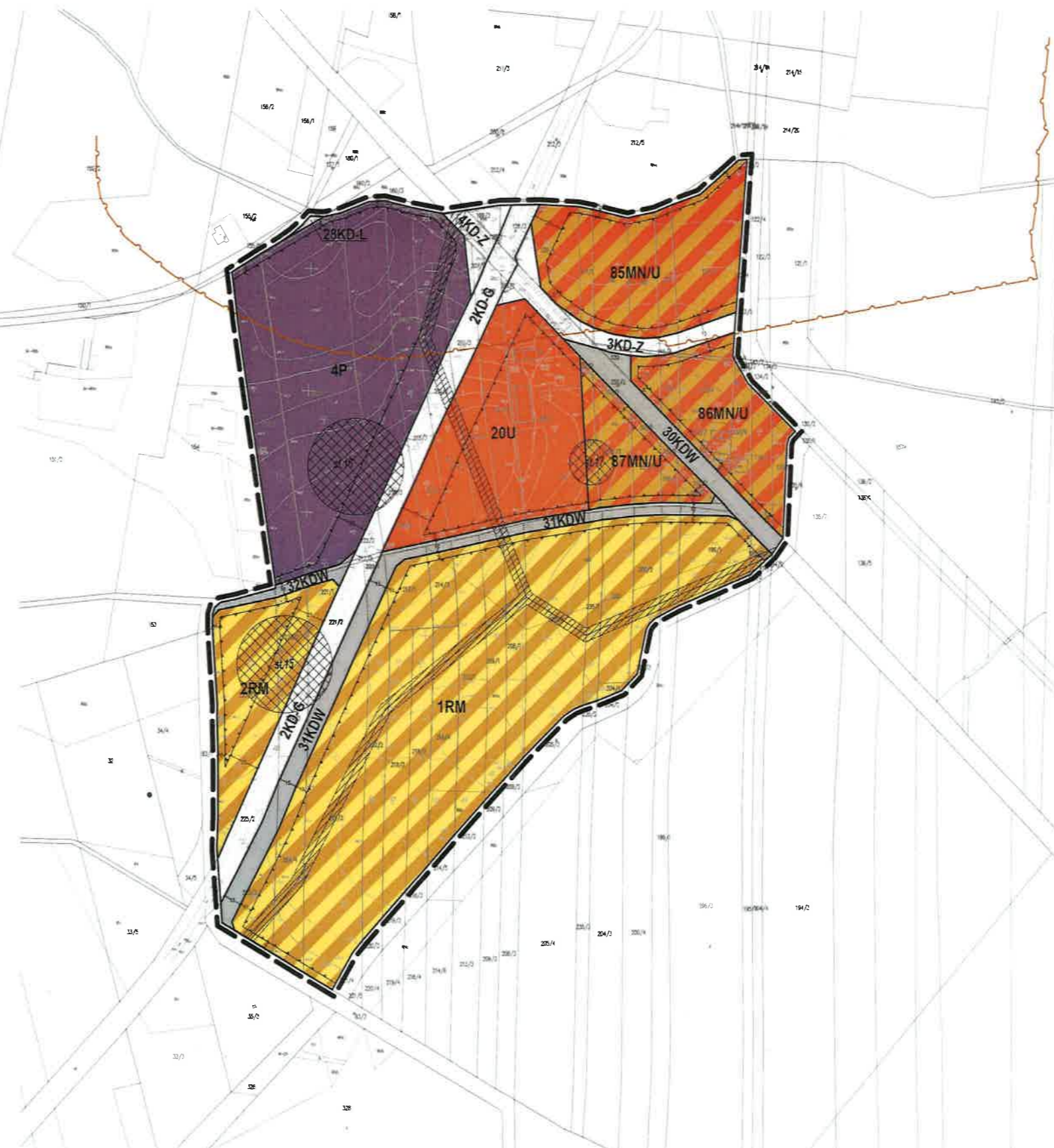
WYRYS ZE STUDIUM UWARUNKOWAN I KIERUNKÓW ZAGOSPODAROWANIA PRZESTRZENNEGO GMINY KLECZEW Z OZNACZENIEM GRANIC OBSZARU OBJĘTEGO PLANEM SKALA 1:20 000

UKŁAD WSPÓŁRZĘDNYCH: PUWG 2000 STREFA 6 MAPA ZASADNICZA POZYSKANA Z PAŃSTWOWEGO ZASOBU GEODEZYJNEGO I KARTOGRAFICZNEGO